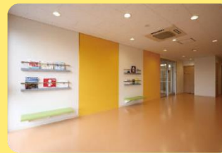
クリニック フレイルーム