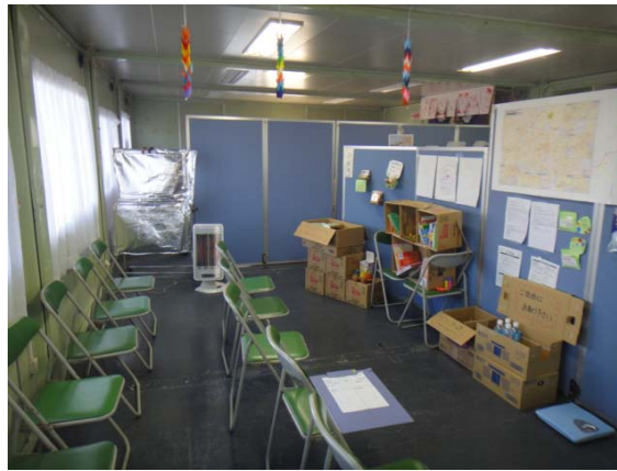
待合室、飾り付けが少しあります