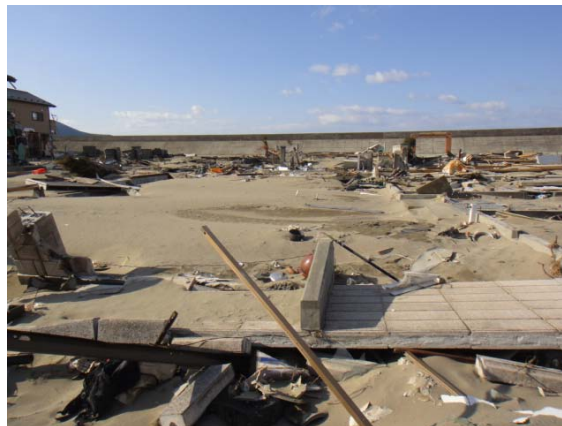
堤防付近は家が全壊