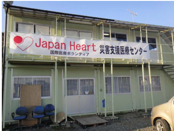
1階は診察室、2階で寝泊まり