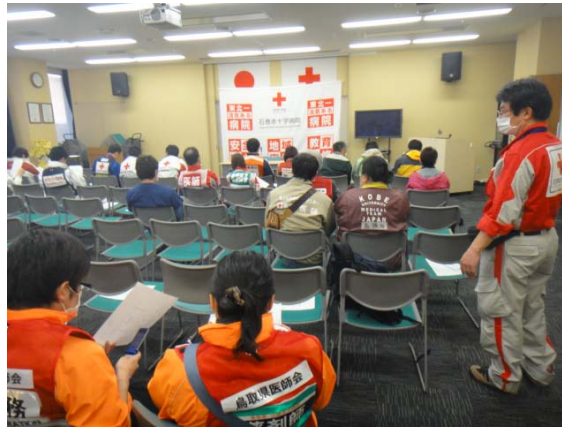
石巻市の医療関係者の話し合い