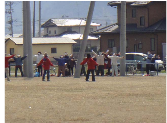
配給待ちの人々とラジオ体操