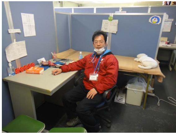
診察室、建物はプレハブ