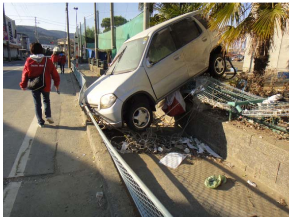
避難所である小学校